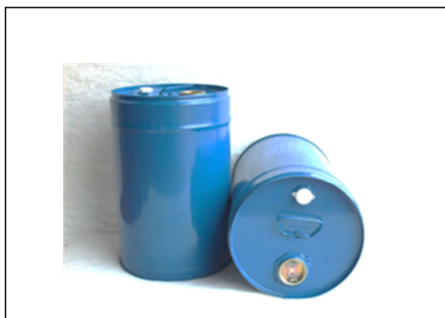
Fusti in ferro: idonei alla raccolta di rifiuti speciali, solidi o liquidi. Da 60, 120 e 200 lt.