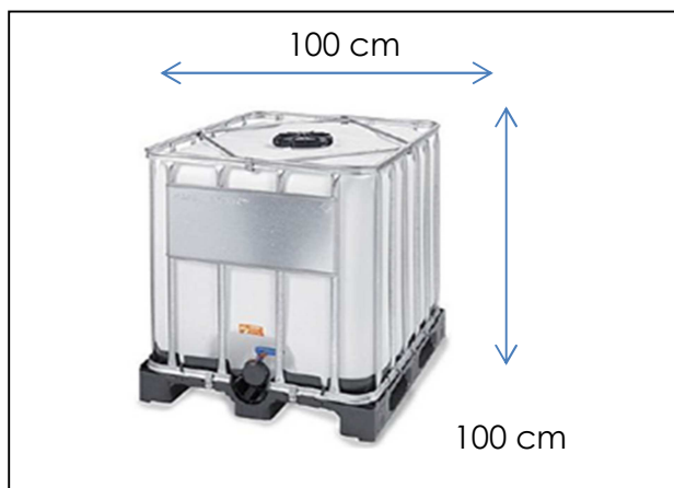
Cisterna in polietilene: capacità 1 mc. Idonea per la raccolta di rifiuti liquidi.