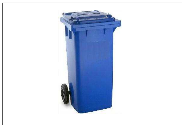
Bidone: bidone carrellato, capacità 120 o 240 lt, idoneo per la raccolta differenziata dei rifiuti.