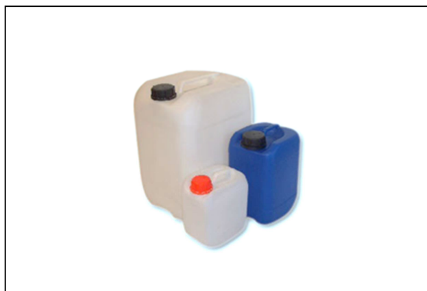
Taniche in polietilene: Idonee per la raccolta di rifiuti liquidi. Da 10, 20, 25 e 30 lt.