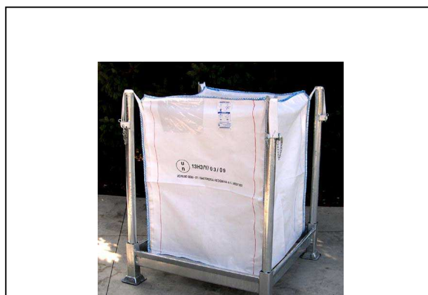
Reggi big-bags: Telaio zincato per supporto sacco big-bags.