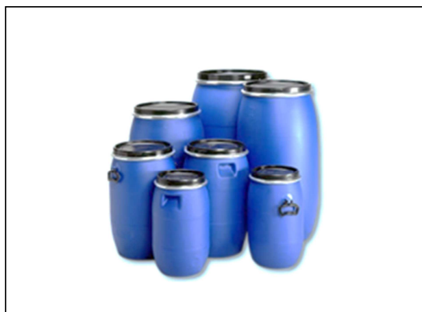
Fusti in polietilene: idonei alla raccolta di rifiuti speciali, solidi o liquidi. Da 30, 60, 120, e 220 lt.