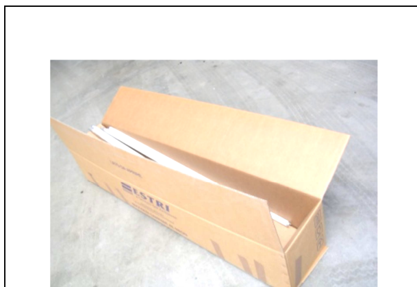
Neon box: Contenitore in cartone per la raccolta di neon esausti.