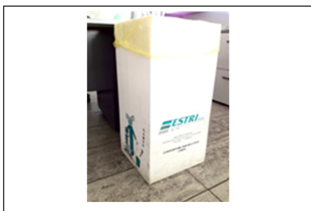
Toner box: contenitori per la raccolta differenziata dei toner esausti. Capacità 60 lt.