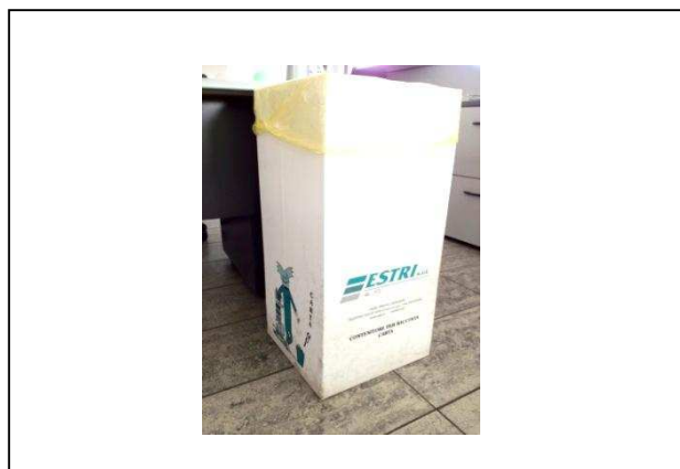
Paper box: contenitori per la raccolta differenziata della carta. Capacità 15 lt.