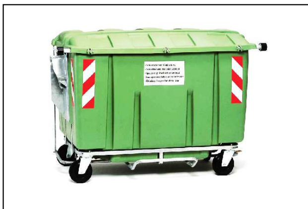
Cassonetti: da 1,3 o da 1,7 mc. Contenitori chiusi attrezzati per il ribaltamento dei rifiuti nell'autocarro satellite.